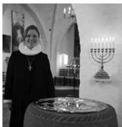
En fantastisk dag i mit liv, min ind- sættelse her i Årby kirke.