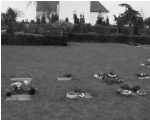
Parti fra den relativ nye plænebegravelsesafdeling.

tioner, som rådet skal forvalte? Det er for det første den daglige drift af kirkebygningen samt embedets andre bygninger så som præstegård og Sognegård. Dertil kommer embedets jordtilliggende som er kirkegården og præstegårdsjorden. Rådet har desuden en vigtig funktion som arbejdsgiver, da der som bekendt er ansat et personale ved Kirken. Det drejer sig om organist, graver, gravermedhjælper, kirkesanger, samt løst ansat personer til vikarbejde og forefaldende arbejde.