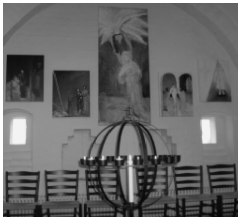
Fra det nyindrettede børnevenlige rum i kirken.