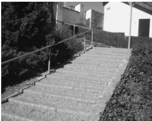
Den nyrenoverede og mere brugervenlige trappe.

I de seneste mange måneder har rådet som følge deraf kun fungeret ved hjælp af tre aktive medlemmer samt præsten. Det er