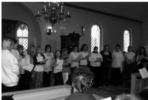
Koret + koret fra Veberød i Veberød Kirke d. 2. marts.