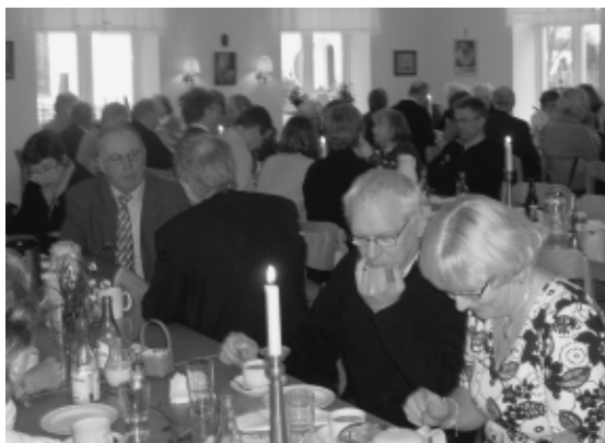
Fra frokosten efter gudstjenesten.

også, at det med sprogvanskeligheder slet ikke er så stort et problem, som man fra begge side ofte gør det til. Der blev i det hele taget snakket godt i det fyldte lokale, og der blev fra skånsk side udtrykt ønsket om, at vi bør ses mindst to gange