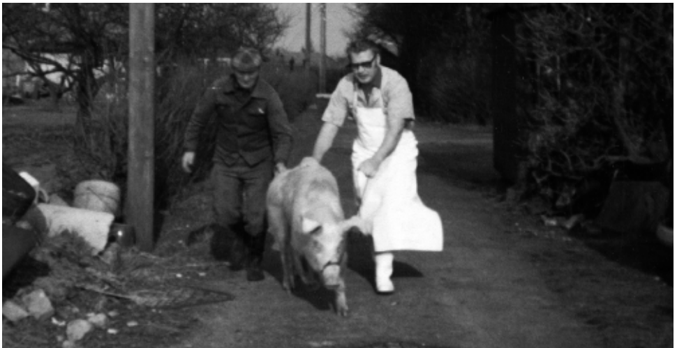
Medens man endnu slagtede "julegrisen" selv. 1980.