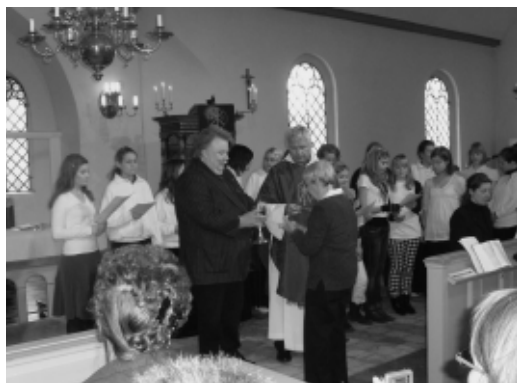
Fra altergangen under fællesgudstjenesten.