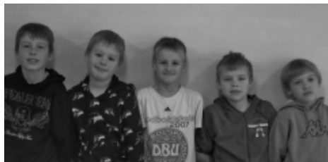
Fem dejlige juniorkonfirmander.

Børnene kan være forvirrede over forskellen mellem at tro, at mærke og at vide. Et af børnene kan sige: "Jeg ved ikke rigtig, om Gud findes". Det samme barn kan samtidig udtrykke en fuldt oplevet og sanset Guds kraft i den anden sammenhæng fra deres dagligdag.