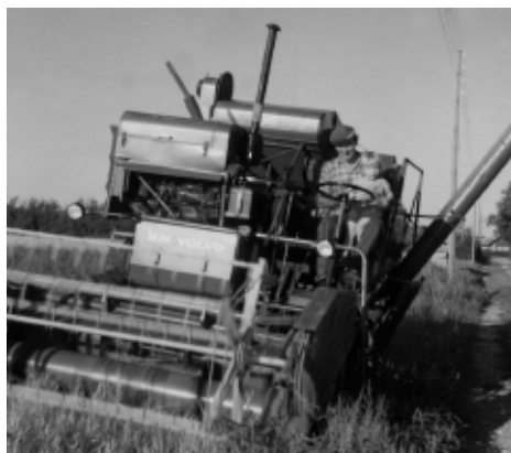
Mejetærskning på Engvej, da det endnu var alm. landbrug. 1972.

Der er børneinstitution på Agervej. Jeg kan huske, den blev indviet d. 24 juli 1971, samme dag, som min datter blev døbt. Mine børn har aldrig været i børnehave, da vi valgte at lade dem blive passet privat. Sønnen kørte meget med mig, for jeg kørte mælk dengang. Da han var 3-4 år, da blev han sat ind i lastbilen om morgenen, og så kørte vi til efter middag. Jeg kørte mælk til Lidano fra Odsherred, Rerslev, Røsnæs og Havnsø. Der var et lille hundrede leverandører. De nedlage andelsmejerierne rundt omkring, hvad mange var sure over, men så