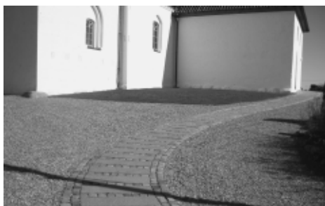
Parti fra den brugervenlige opkørsel til bl.a. køreskole

Jeg håber, at denne omtale har vakt interesse hos rigtig mange læsere, så vi kan få valgt et fuldt, foretagsomt, aktivt og inspirerende menighedsråd til efteråret. Næste nummer vil bringe en mere detaljeret omtale af det kommende valg. Vel mødt til menighedsrådsvalg til efteråret!