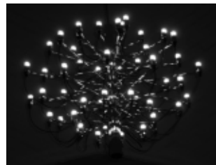
En af de nye kirkelysekroner.

Ved det indledende møde til et menighedsrådsvalg kommer der almindeligvis ikke flere interesserede, end at det